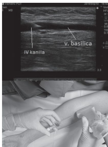
Slika 2. Ultrazvučni prikaz kateterizacije u „in plane“ tehnici (po dužini UTZ snopa).