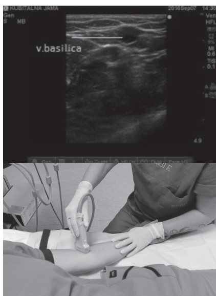
Slika 1. Ultrazvučni prikaz vene u „out of plane“ tehnici (poprečno na UTZ snop).